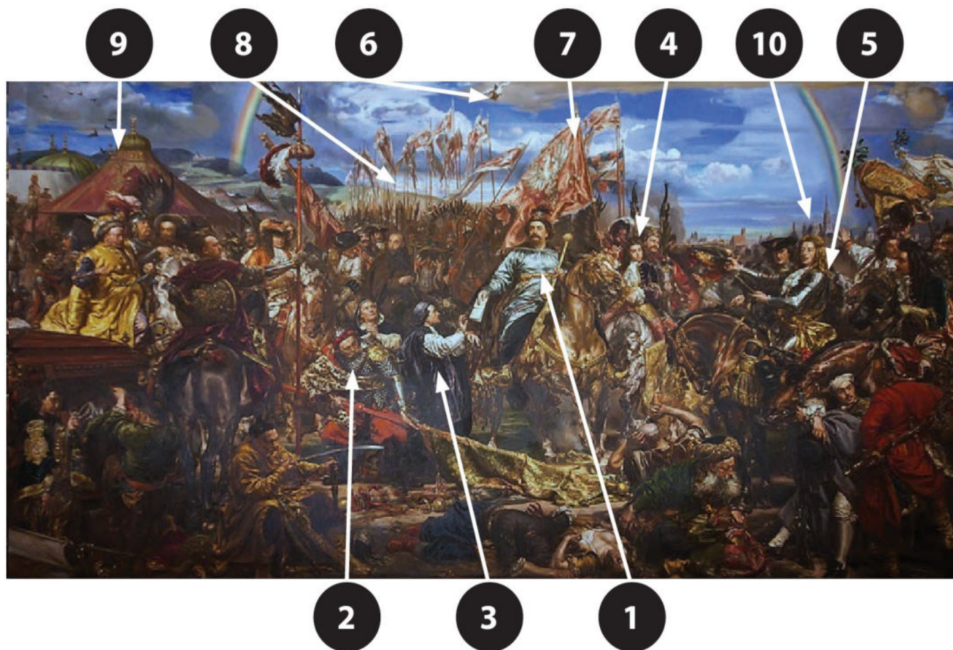
Jan Matejko, Sobieski pod Wiedniem , 1883 r.

Pytanie 15 (2pkt) Na podstawie przedstawionego obrazu oraz wiedzy własnej rozstrzygnij, które zdania są prawdziwe, a które fałszywe. W tabeli wpisz odpowiednio: P (prawda), F (fałsz).