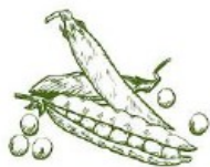
fasola / groszek / groch